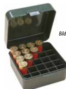
Bild zeigt optimales Zubehör